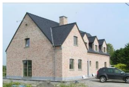
Meditec, Colmar (France)