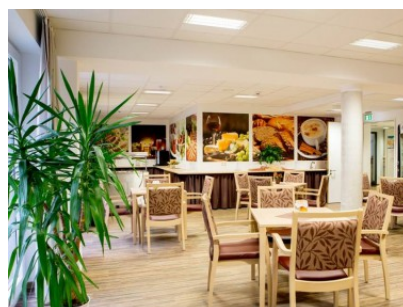
Senior citizen home, Asslar (Germany)