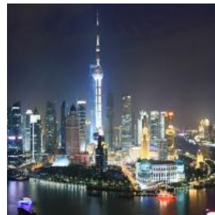
Vossloh-Schwabe 办公室 中国上海