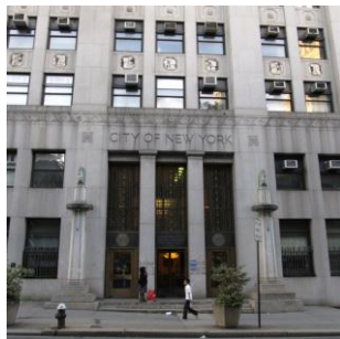
纽约市卫生署 美国