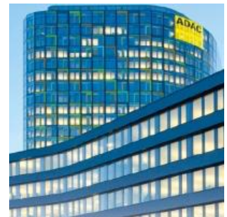
ADAC 总部 德国慕尼黑