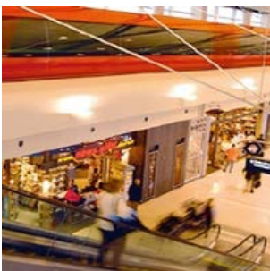
Wayne County Airport Authority (USA)