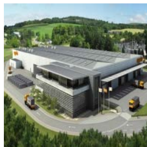
Aggreko Factory (UK)