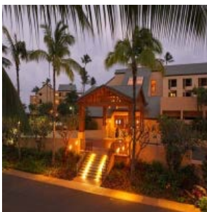
Energy Saving Hotels (USA)