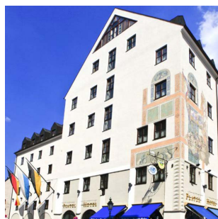
Platzl Hotel, München (Deutschland)