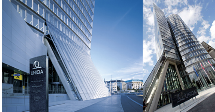
Uniqa Firmenzentrale Wien: EnOcean Funk-Raumfühler in 22 Etagen

Steuerung mittels richtig platzierter Sensoren (Temperatur, Feuchte, Anwesenheit) ist hier der richtungweisende energie- und umweltschonende Ansatz.