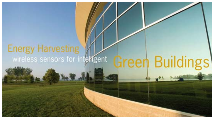
EnOcean steht für Intelligente Grüne Gebäude

EnOcean basierte Funkgeräte werden weltweit von namhaften Produktherstellern in deren Systemlösungen für intelligente energieeffiziente Gebäude eingesetzt. Die EnOcean-Allianz ist ein Konsortium unabhängiger Systemintegratoren und führender Hersteller im Bereich der Gebäudeautomation. In einer starken internationalen Gemeinschaft können Energie-sparpotentiale und Kostenvorteile breit kommuniziert werden. Das intelligente Grüne Gebäude wird Realität.