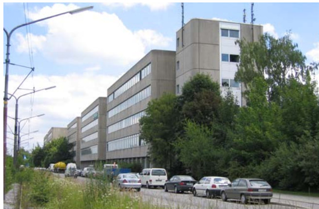
Siemens München: Licht- und Jalousiesteuerung in 11 Bürogebäuden mittels EnOcean-Funktaster

Innenjalousien sind ein Blendschutz. Sie verhindern im Gegensatz zu Außenjalousien aber nicht die Aufheizung des Raumes im Sommer. Außenjalousien und Markisen verringern damit den Energiebedarf für die Klimaanlage, fordern aber auch eine flexible Bedienung direkt vom Arbeitsplatz oder von der Wohnzimmercoach aus. Funksteuerungen setzen sich daher immer mehr durch. Aktuell werden in Europa bereits 25% aller elektrischen Rollläden und 60% aller Markisen über Funk gesteuert (Quelle: IO Homecontrol).